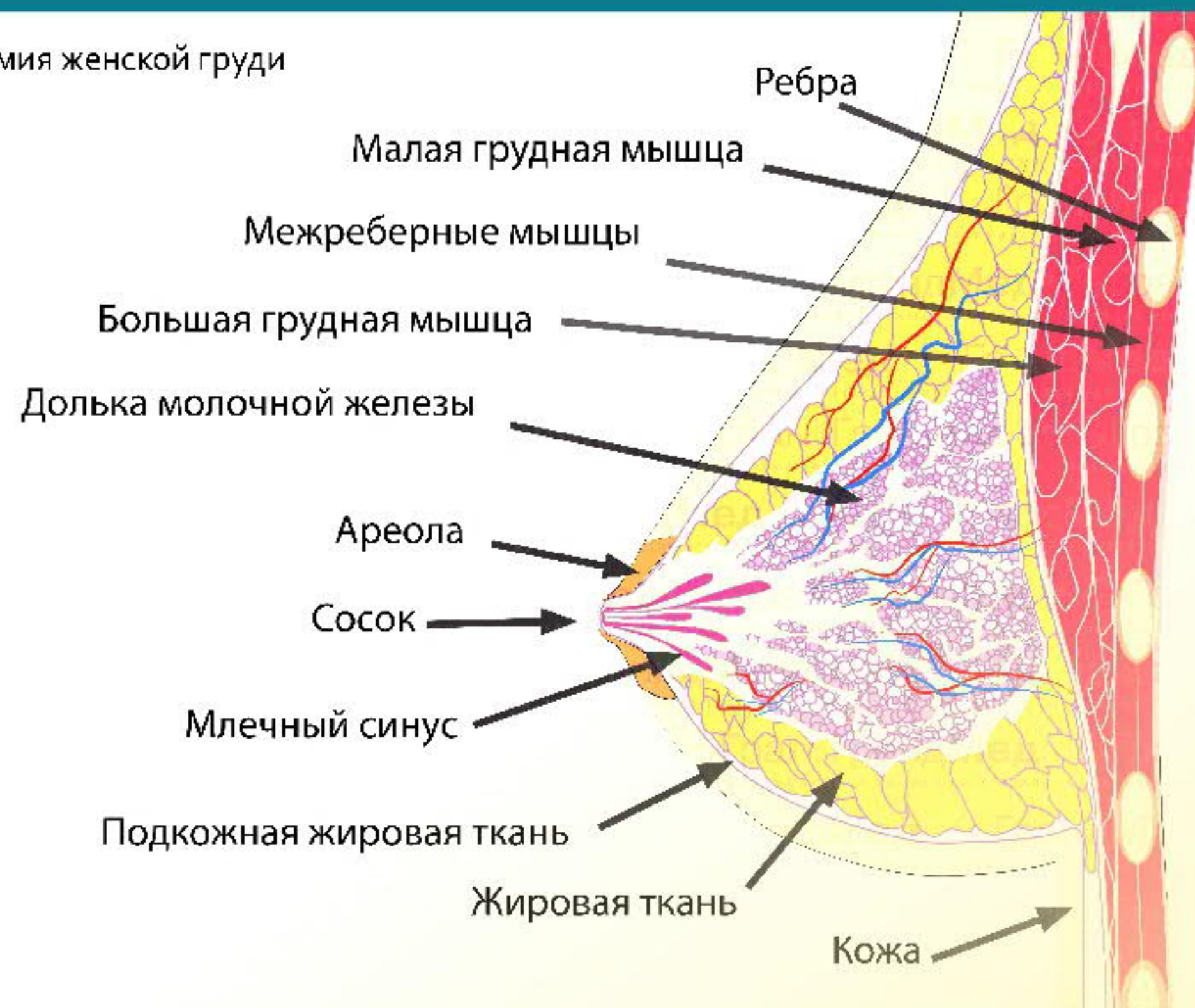
Анатомия женской груди

В большинстве случаев рак развивается в результате быстрого, неконтролируемого роста протоковых или дольковых клеток. Среди этих клеток располагаются кровеносные и лимфатические сосуды, которые образуют сосудистую сеть молочной железы. Лимфатические узлы участвуют в борьбе организма с инфекциями; они проходят к подмышечным лимфатическим узлам, которые располагаются в подмышечной впадине и в внутригрудным лимфатическим узлам, которые расположены с обеих сторон грудины. Когда раковая опухоль выходит за пределы молочной железы, в процесс вовлекаются именно эти узлы: вот почему любое обследование молочных желез включает обследование и этих узлов.